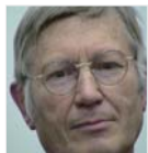
Prof. Dr. Joachim Radkau

Prof. Dr. Joachim Radkau Do. 13.10., 19.30 – 21.00 Uhr, EUR 6,50 vhs, Ahornring 121, Raum 3.1